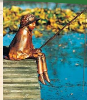
Junge mit Angel, H 60 cm