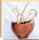
Vase in Kupfer handgezeichnet