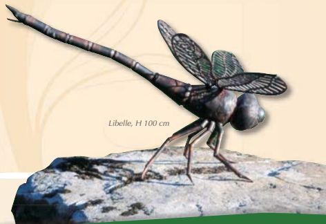
Libelle, H 100 cm