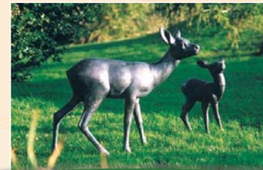
Ricke mit Kitz, lebensgroß

Betreten des Freigeländes auf eigene Gefahr, Eltern haften für ihre Kinder!