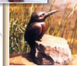
Eisvogel / Bronze, H 14 cm