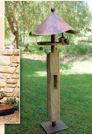
Vogelfutterhaus, H 155 cm