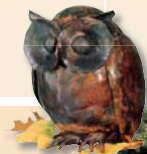
Eule, H 30 cm

Hubert Kruft hat seine Kunstwerke zwar an der heimischen Tierwelt angelehnt, aber keineswegs rein naturalistisch gearbeitet, denn die charakteristischen Merkmale einer jeden Spezies werden leicht übertrieben, in reduzierter Form, dargestellt.