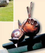
Eifelspatz, H 14 cm

Teilweise sind die Arbeiten in Bronze gegossen oder in Kupfer von Hand getrieben. Hinzu kommt eine Vielzahl verschiedenster Kupferbrunnen für Haus und Garten.